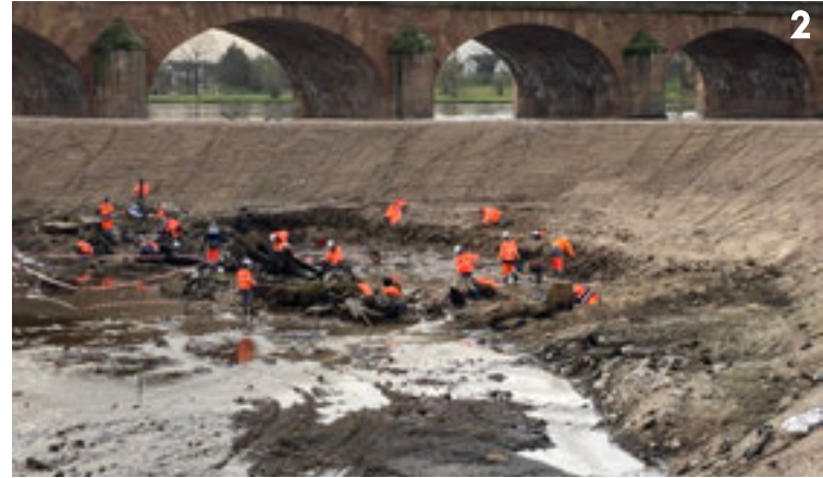
Photo 1 : Les travaux se poursuivent sur la passe à poissons. Photo 2 : Depuis le 7 décembre, les archéologues sont à l'œuvre.