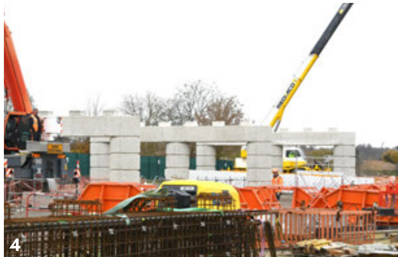
Photo 3 : Ce coffrage constitue le "chevêtre" des piles du viaduc. Il s'agit de la partie supérieure qui portera la structure du pont. Photo 4 et 5 : Les appuis de l'ouvrage secondaire sont presque terminés. Photo 6 : La pile P2, deuxième pile du viaduc, en cours de construction.